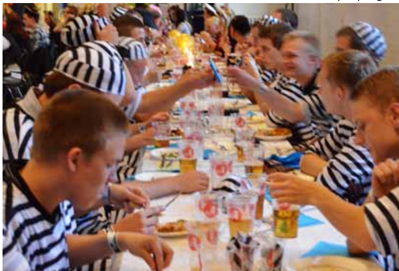
Politiklassen på springtur?

* Her indgår et samarbejde med relevante videregående uddannelser. Spørg evt. din studievejleder.